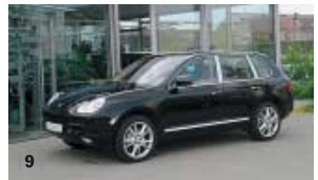
| 9 | Porsche Cayenne S , schwarz, EZ 01/07, 10.900 km Euro 59.800,-*

Wer sich für den Kauf eines Porsche entscheidet, der entscheidet sich für Qualität, Exklusivität und Sportlichkeit.