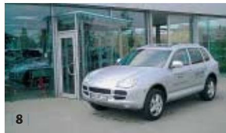
| 8 | Porsche Cayenne S , kristall- silber, EZ 12/06, 9.800 km Euro 58.800,-*