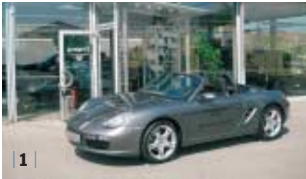
| 1 | Porsche Boxster (987) , meteorgrau, EZ 08/07, 2.900 km Euro 47.900,-*

Das komplette und tagesaktuelle Fahrzeugangebot finden Sie auf unserer Internetseite: www.porsche-rostock.de