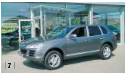
| 7 | Porsche Cayenne , meteorgrau, EZ 08/07, 4.900 km Euro 61.490,-*