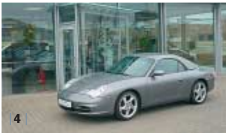
| 4 | Porsche 911 Carrera Cabriolet (996) , sealgrau, EZ 03/03, 34.600 km, Euro 62.900,-*