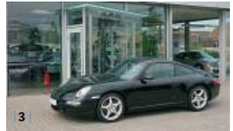
| 3 | Porsche 911 Carrera Coupé (997) , schwarz, EZ 02/05, 68.900 km, Euro 69.400,-*