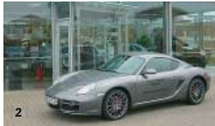
| 2 | Porsche Cayman S , meteor- grau, EZ 06/07, 3.400 km Euro 65.800,-*