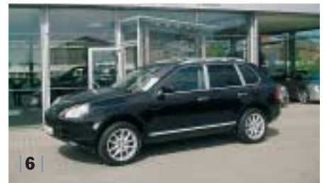
| 6 | Porsche Cayenne , schwarz, EZ 11/06, 18.900 km Euro 49.900,-*