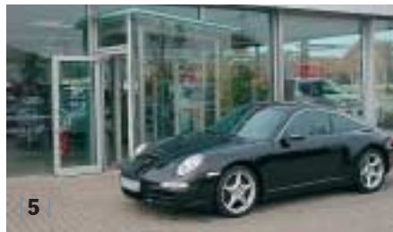
| 5 | Porsche 911 Targa 4 (997) , basaltschwarz, EZ 09/07, 4.900 km, Euro 94.900,-*