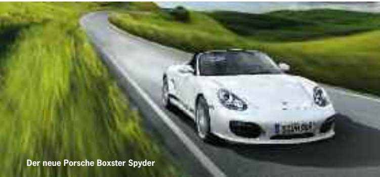
Der neue Porsche Boxster Spyder