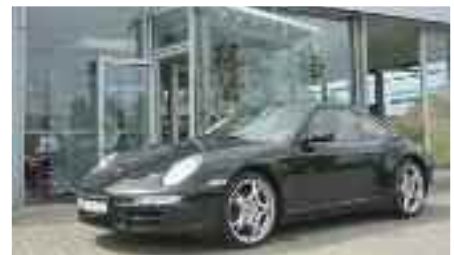
6 Porsche 911 Carrera 4S Basaltschwarzmetallic EZ 12/2005 | 103.700 km | 59.900 EUR*