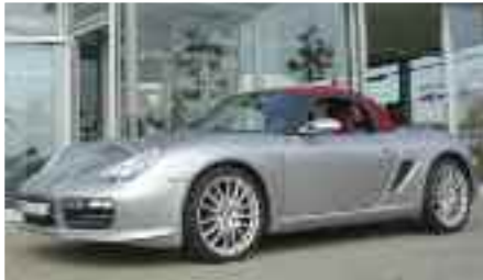
1 Porsche Boxster RS 60 Spyder GT-silbermetallic EZ 03/2008 | 10.000 km | 52.900 EUR*

Bei unseren Angeboten bekommt selbst der Winter kalte Füße. Wir zeigen Ihnen, wie einfach der Einstieg in die Sportwagenklasse ist. Tagesaktuelle Angebote finden Sie unter www.porsche-rostock.de .