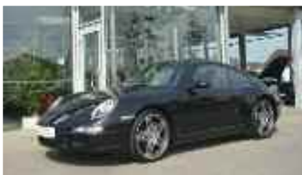
7 Porsche 911 Carrera 4S Dunkelolivemetallic EZ 04/2006 | 36.200 km | 69.900 EUR*