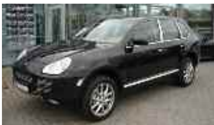
11 Porsche Cayenne S Tiptronic Basaltschwarzmetallic EZ 09/2006 | 26.800 km | 43.800 EUR*