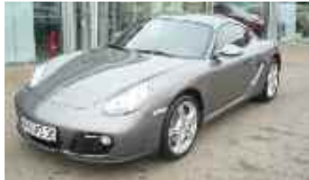
2 Porsche Cayman Meteorraumetallic EZ 01/2009 | 13.000 km | 47.900 EUR*