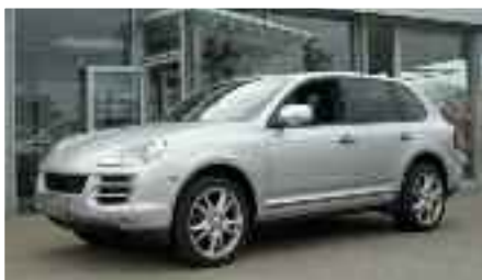
10 Porsche Cayenne Diesel Tiptronic Kristallsilbermetallic EZ 07/2009 | 15.000 km | 66.800 EUR*