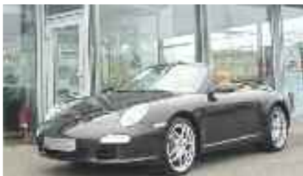
4 Porsche 911 Carrera S Cabriolet Schwarz EZ 07/2009 | 6.000 km | 97.700 EUR*