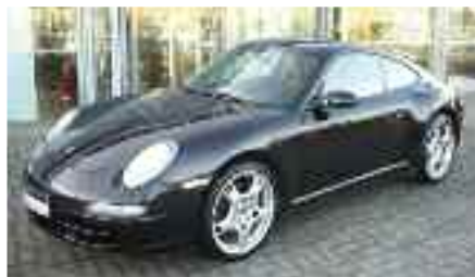
5 Porsche 911 Carrera 4 Basaltschwarzmetallic EZ 01/2006 | 37.200 km | 59.600 EUR*