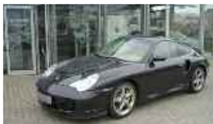
8 Porsche 911 Carrera Turbo S Atlasraumetallic EZ 05/2005 | 58.200 km | 66.900 EUR