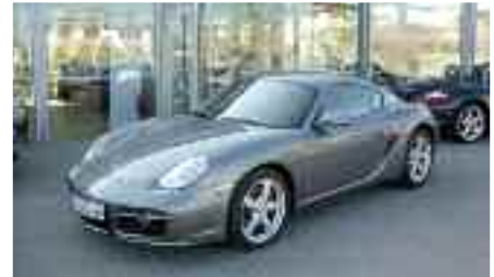
3 Porsche Cayman S Meteorraumetallic EZ 01/2009 | 15.000 km | 52.900 EUR*