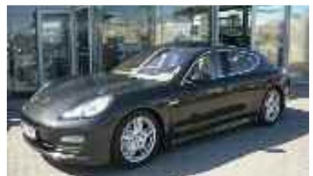
12 Porsche Panamera 4S Carbongraumetallic EZ 08/2009 | 5.000 km | 129.800 EUR*