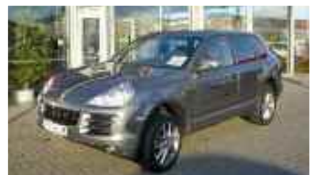
9 Porsche Cayenne Tiptronic Meteorraumetallic EZ 10/2008 | 19.790 km | 49.900 EUR*